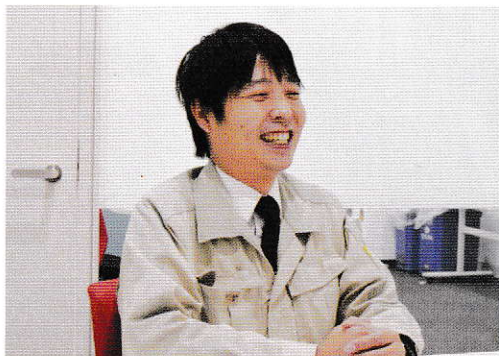
開発営業(自動車) / 2009年入社 / 生産工学部出身

私の場合は学生時代から興味を持っていた分野を仕事に選びました。でも私は、今興味があまり持てなくとも、入社してから興味が持てるのが大切だと思います。その方が仕事に対する愛着を持てるからです。この仕事の良さは、自分が手がけた製品が街中を走っている姿を見られること。私が担当しているリアランプも、よくよく見ると光り方が多様です。どんどん完成車メーカーからの要望が変わるので、色々な製品に挑戦できることは面白いと思います。