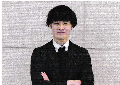
設計開発(自動車) / 2016年入社 / 工学研究科出身

学生時代は化学を専攻していたため、専門外である自動車ランプの設計を仕事にすることは想像もしていませんでした。想像できなかった姿を歩めたのは、入社後の新入社員研修と設計での専門的な研修があったからです。特に設計での研修は設計のいろはをゼロから教えてもらえます。ですが、教えてもらえるとは言っても、自分の力にすることが目的なので、受け身にならず積極的な姿勢で臨むことが大切です。その気概があれば、自分のやってみたいことに挑戦できる環境が当社にはあると思います。